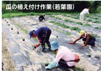
瓜の植え付け作業(若葉園)

獺祭の酒粕を使用した「大吟醸の奈良漬」「きゅうりの粕漬け」を1パック販売につき10円を寄付。 有限会社みかわ(岩国市)